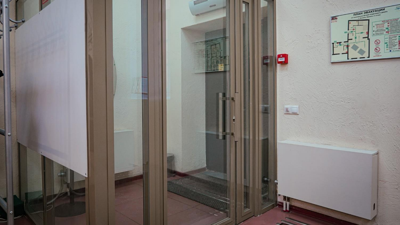
Выход из музея выглядит так.