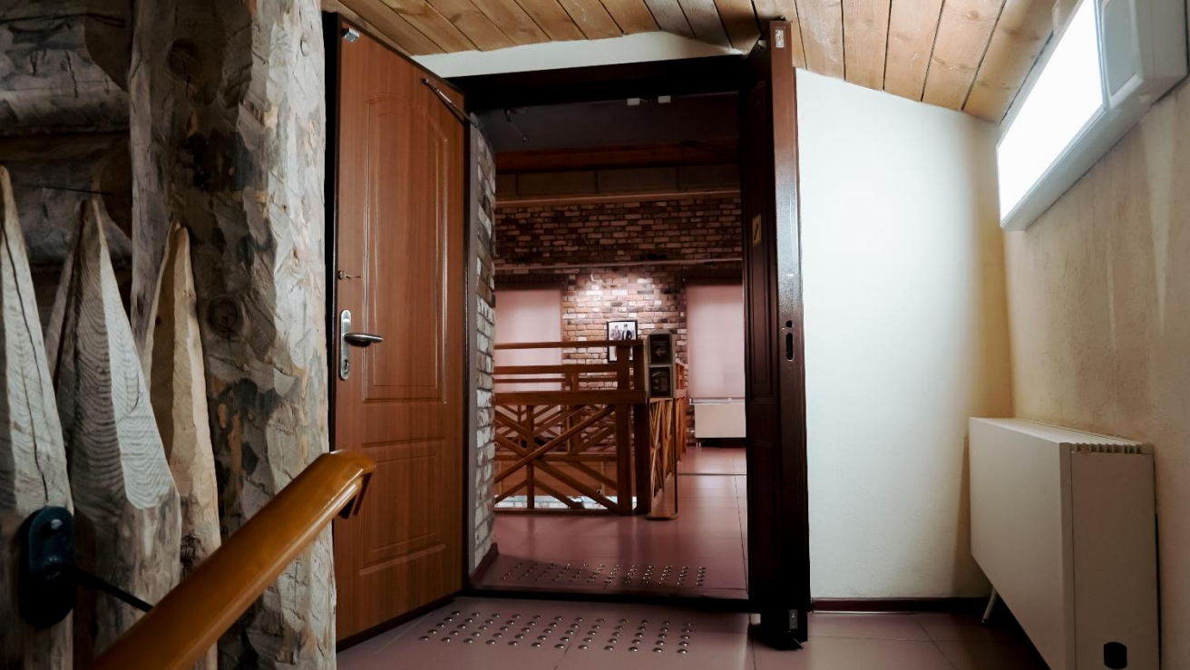
Это 2 этаж музея. Вход в зал выглядит так.