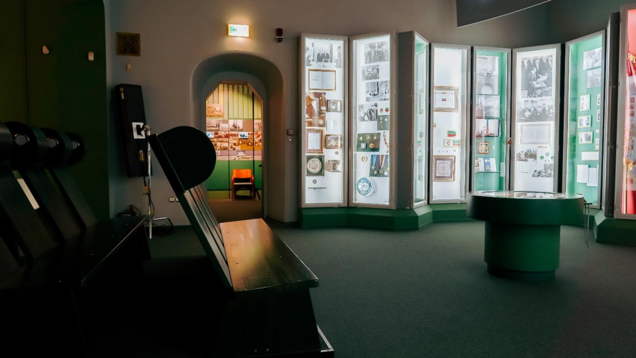
Это зал №3. Он выглядит так.