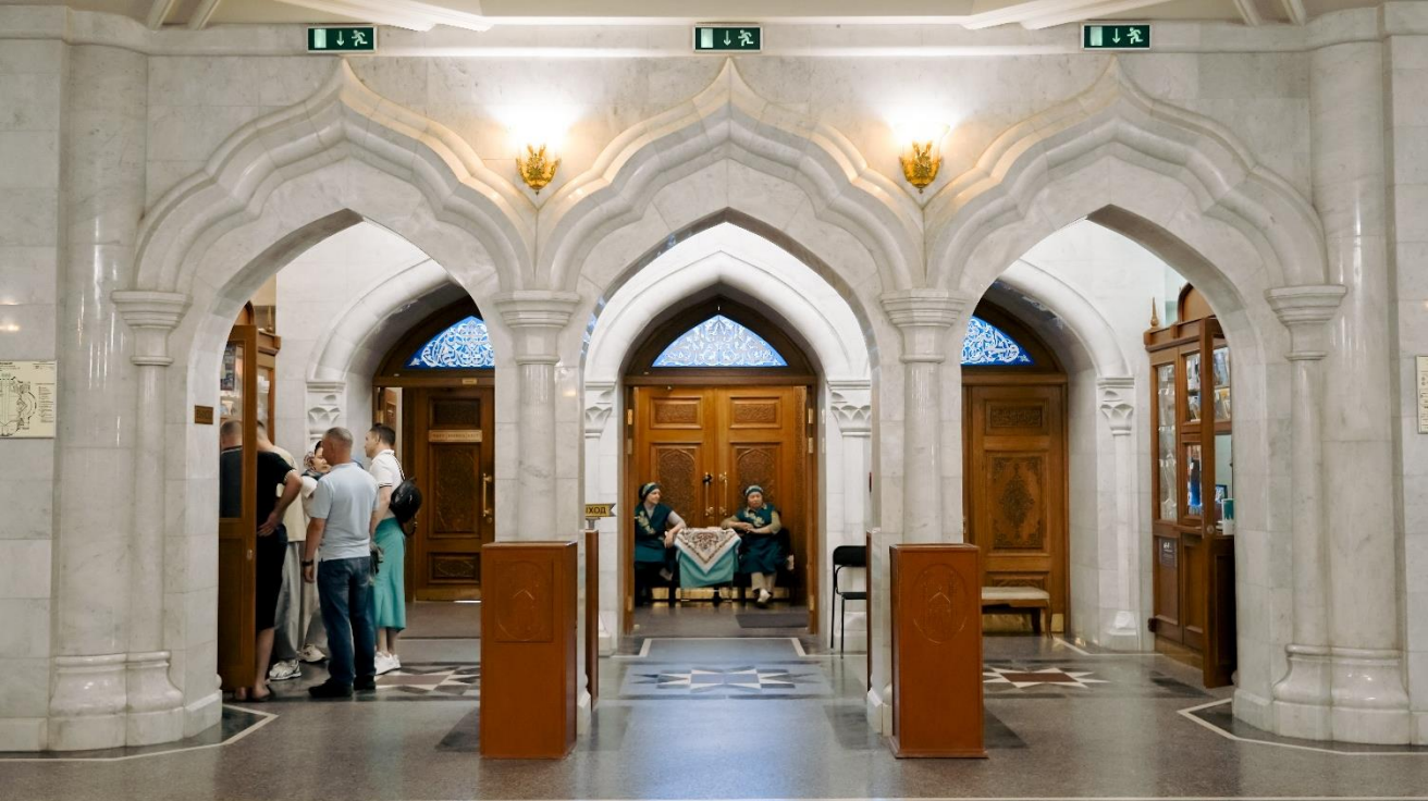
Выход из мечети выглядит так.