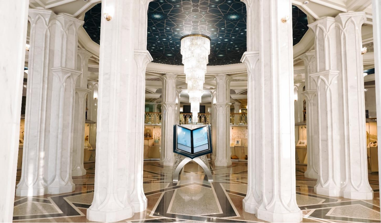
Это 1 этаж музея. Он выглядит так.