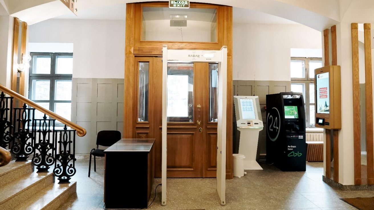
Выход из музея выглядит так.