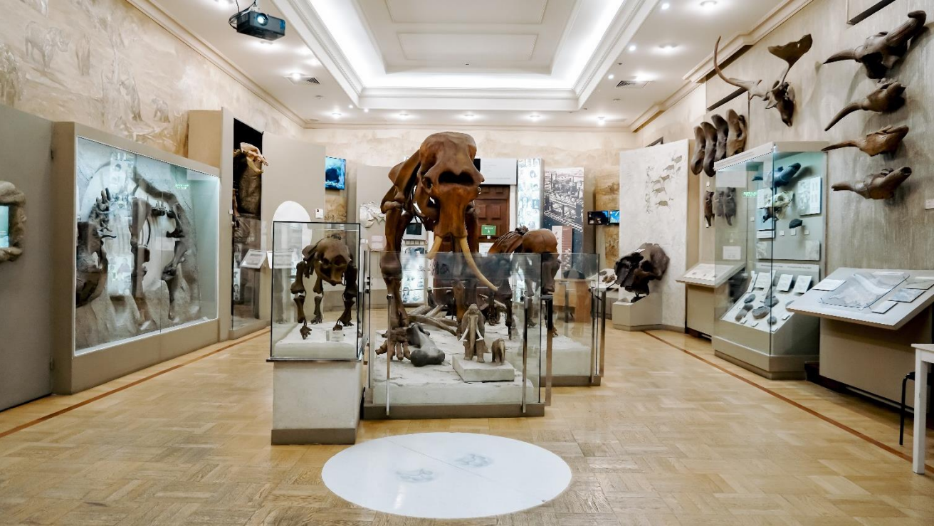
Это зал №12. Он выглядит так. Зал называется «Мир млекопитающих».