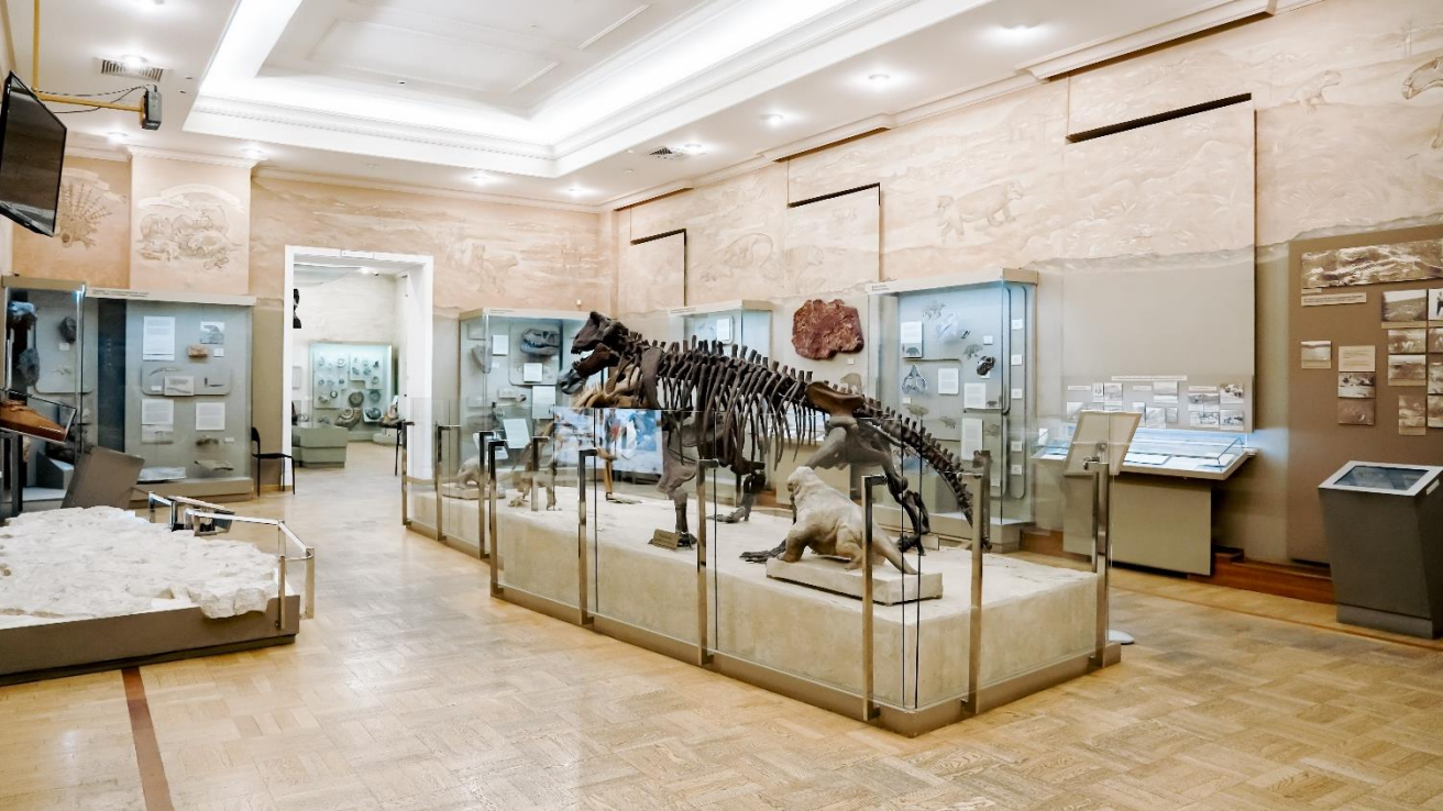
Это зал №9. Он выглядит так. Зал называется «Эпоха зверообразных ящеров».