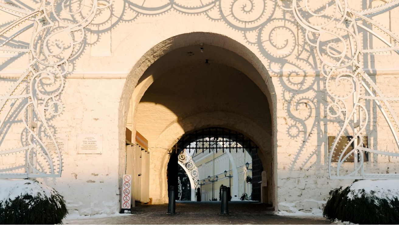
Это арка Спасской башни. Через арку я зайду на территорию Казанского Кремля.