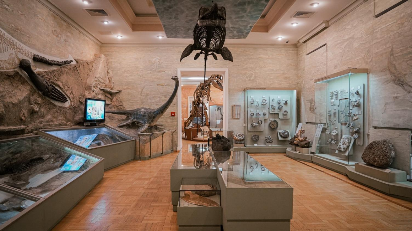
Это зал №10. Он выглядит так. Зал называется «Морские рептилии».