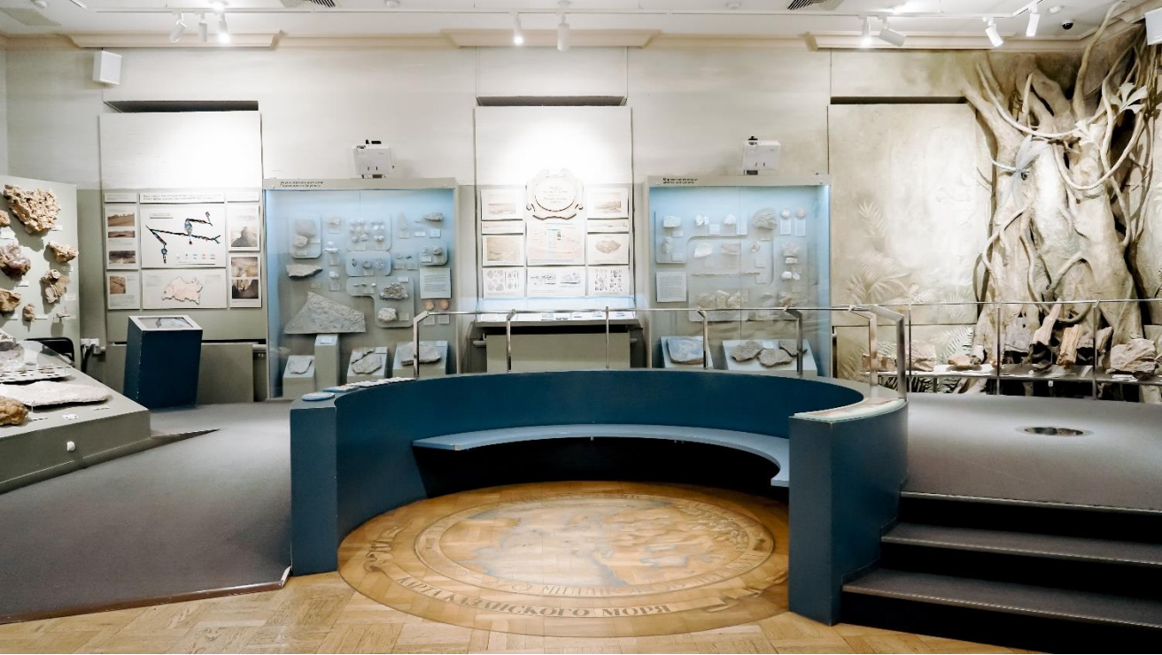
Это зал №8. Он выглядит так. Зал называется «Казанское море».